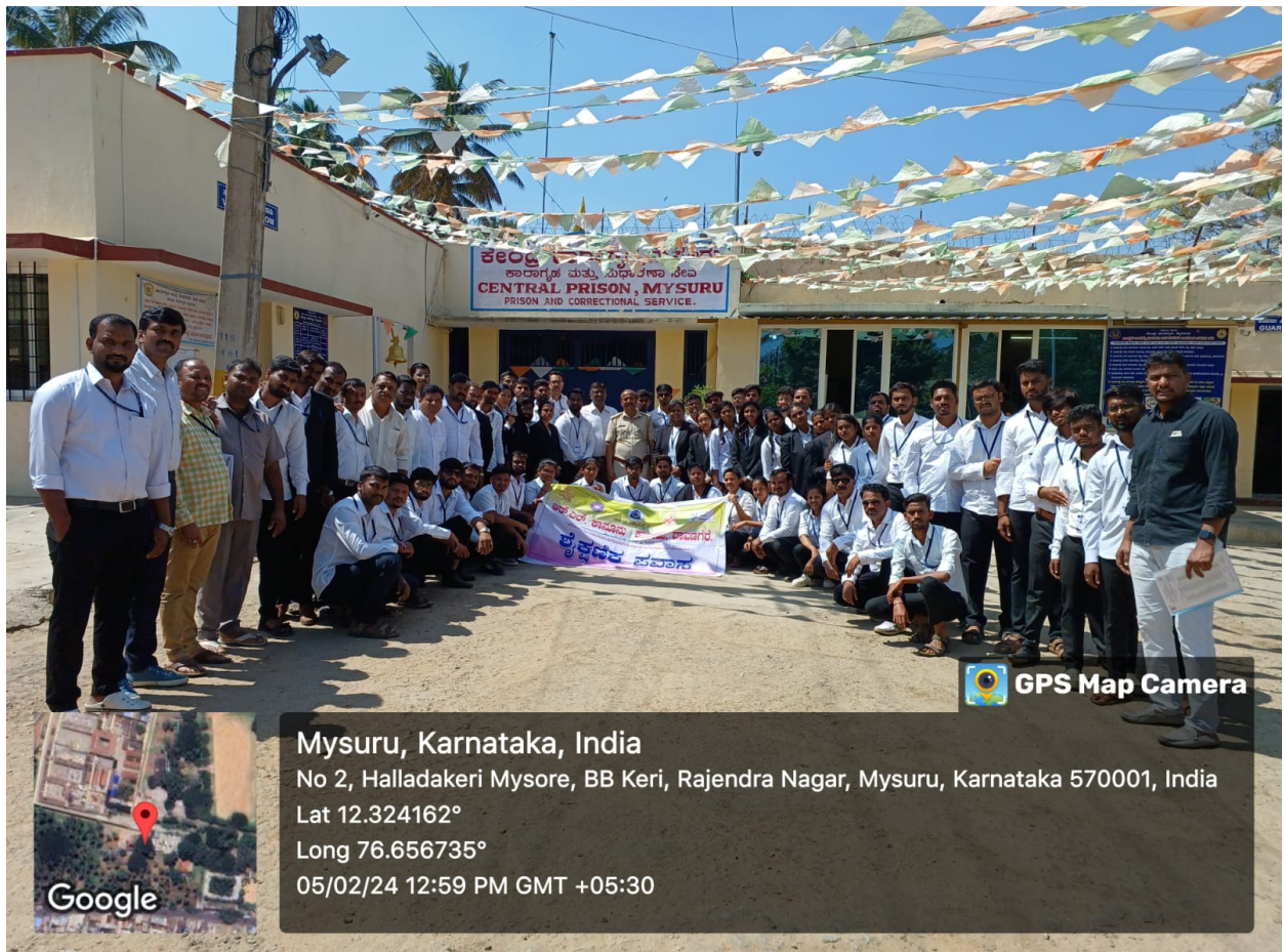
Students, staff and Prison Department officials in front of prison

R.L. Law College has arranged the educational trip to Mysore central prison as a part of co curriculum activity for the academic year 2023-24 on 05-02-2024, 68 students of final year LL.B and B.A.,LL.B visited and observed the prison. Students have interacted with the authorities and collected the detailed information.